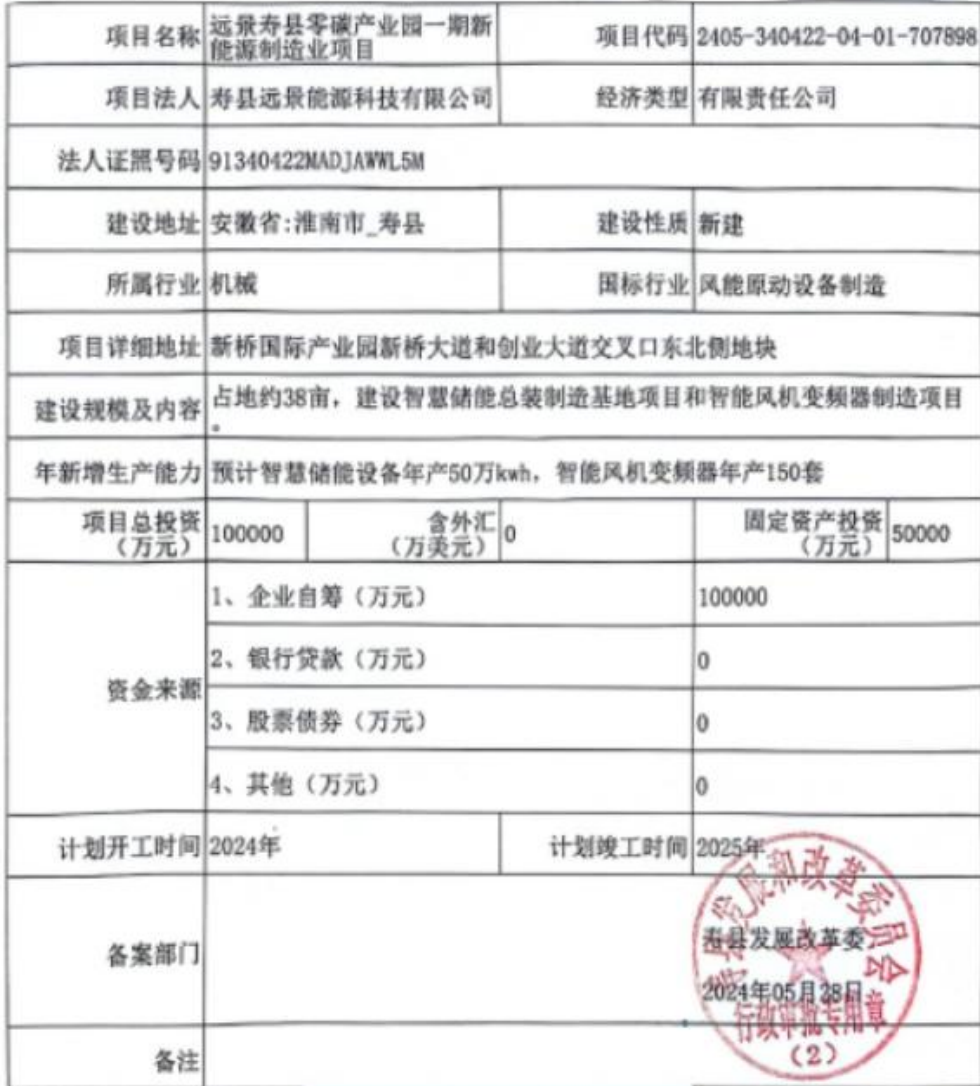
寿县发展改革委项目备案表

注：项目开工后，请及时登录安徽省投资项目在线审批监管平台，如实报送项目开工建设、建设进度和竣工等信息。