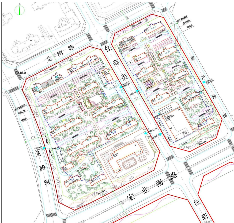
图 1.1-2 项目总平面布置图

根据本工程地质勘测报告，1#~18#为独立基础或者筏形基础、19#~21#配电房、幼儿园、社区综合服务中心为条形基础或独立基础。