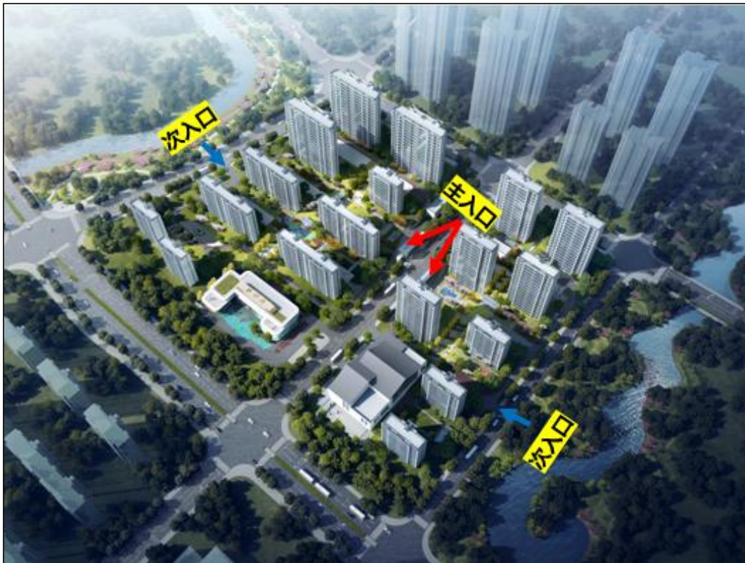
图 1.1-3 项目道路出入口示意图

小区 A 地块主入口设置在住商街，次入口设置在龙腾路。小区 B 地块主入口设置在住商街，次入口设置在望芦西街。A、B 地块永久出入口占地 0.01\text{hm}^2 。