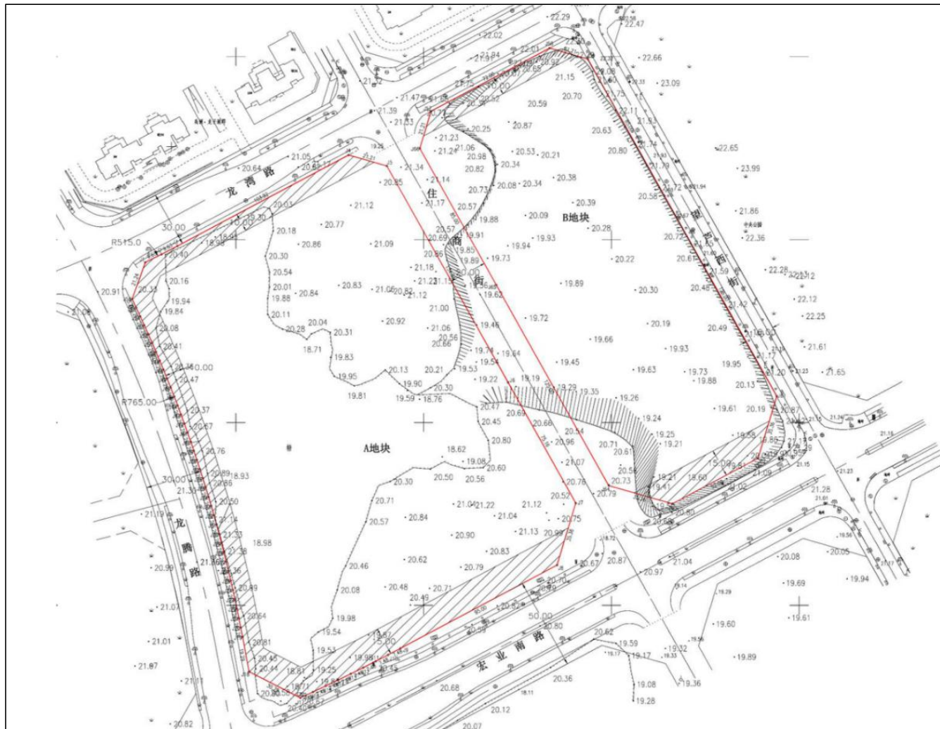
图 1.1-4 项目区原始标高图