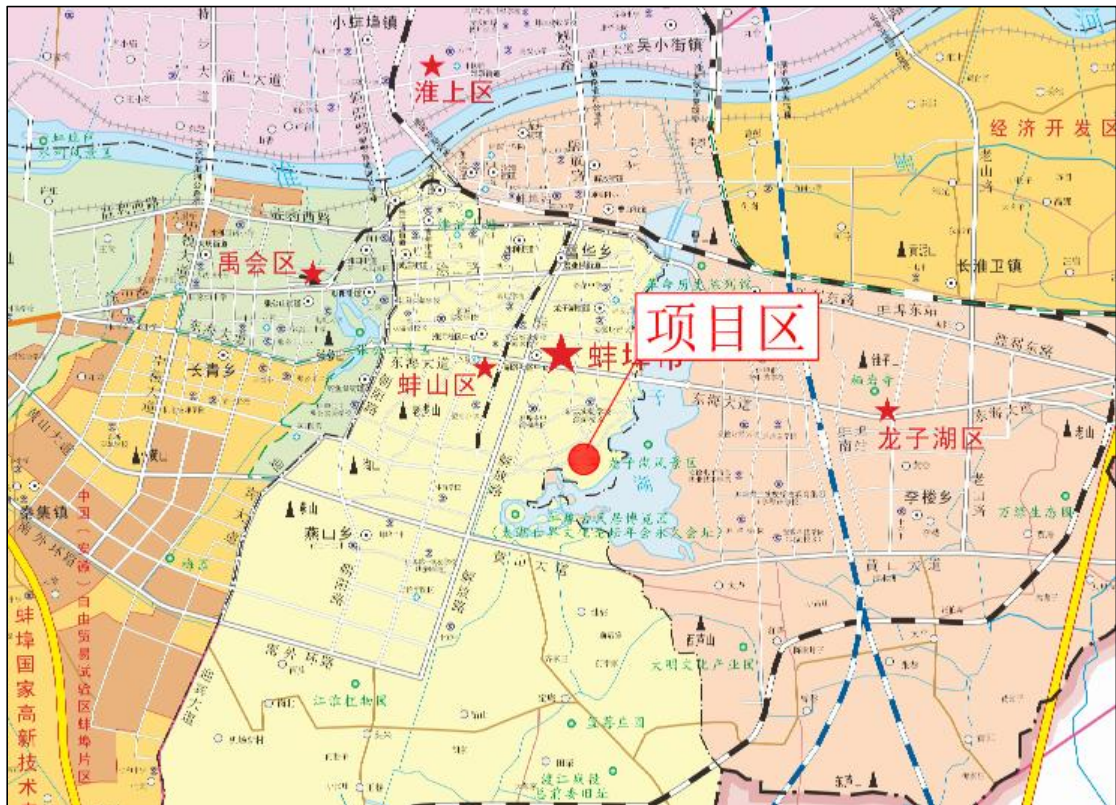
图 1.1-1 项目地理位置图