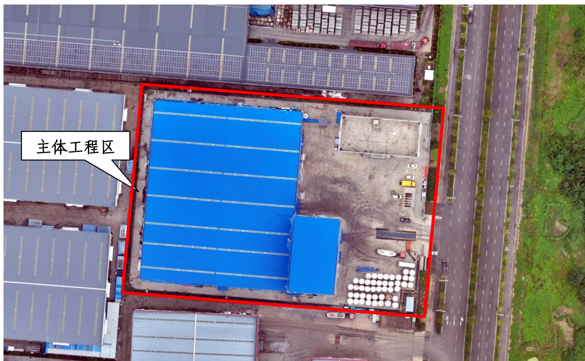
项目完工正射影像（2025 年 9 月）