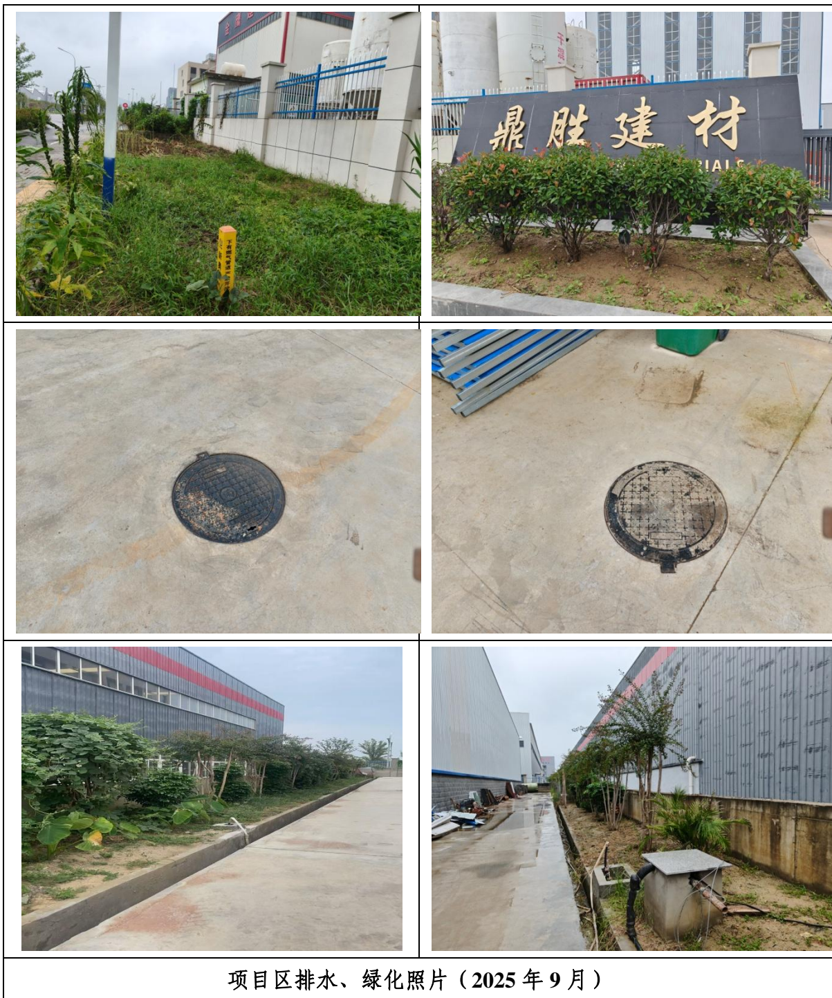
项目区排水、绿化照片（2025 年 9 月）