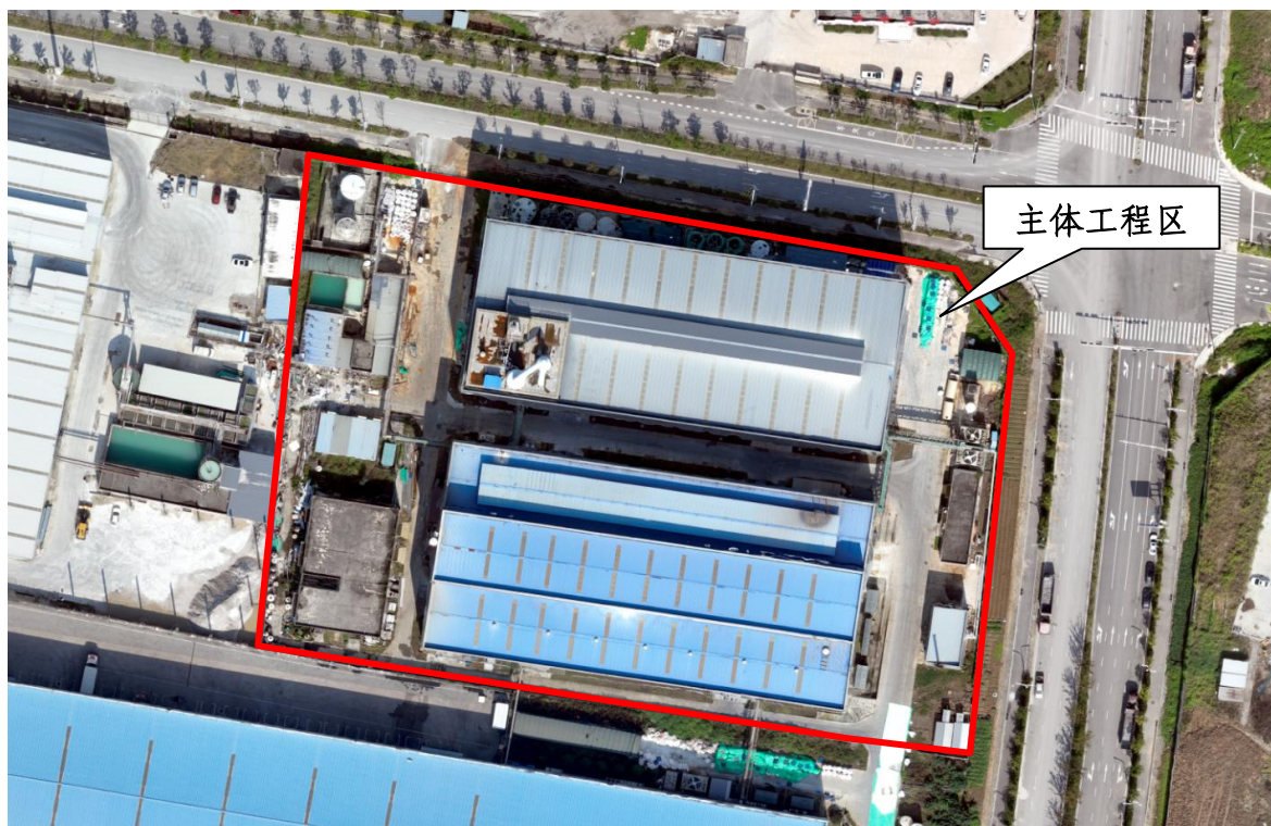
项目完工正射影像（2025 年 9 月）