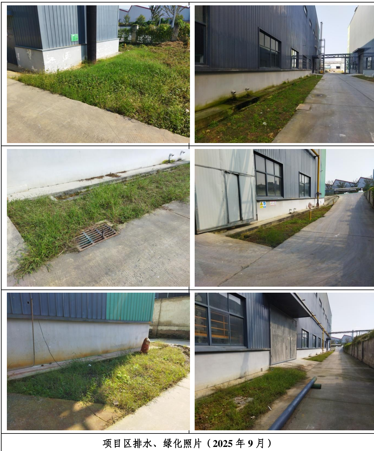
项目区排水、绿化照片（2025 年 9 月）