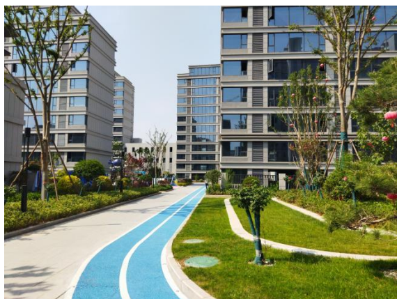
内部道路及周边绿化（2025.5）