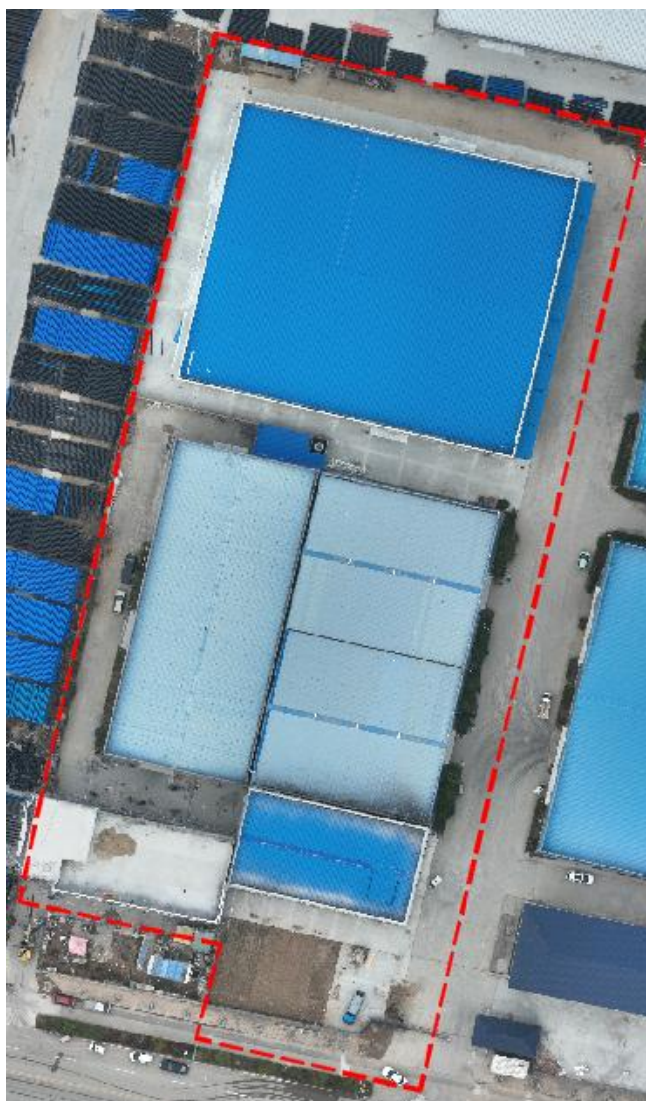
项目区现状正射影像 (2025.2)