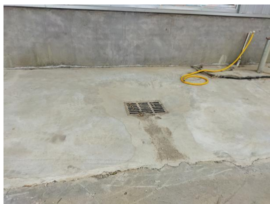
雨水管线以及雨水井 (2025.2)