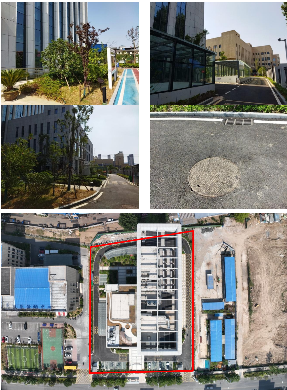
项目区排水、绿化照片及整体航拍（2024年8月）