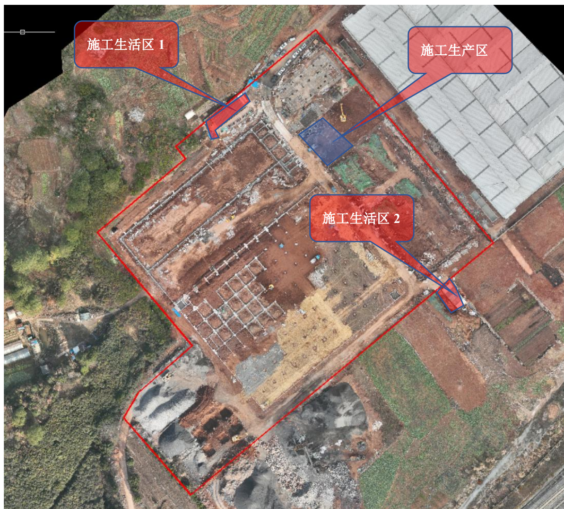
图 1.3-1 施工生产生活区位置图

根据主设，施工生产区布设在红线范围内，占地面积为 270m 2 ，主体工程结束后，建设为场内停车位。