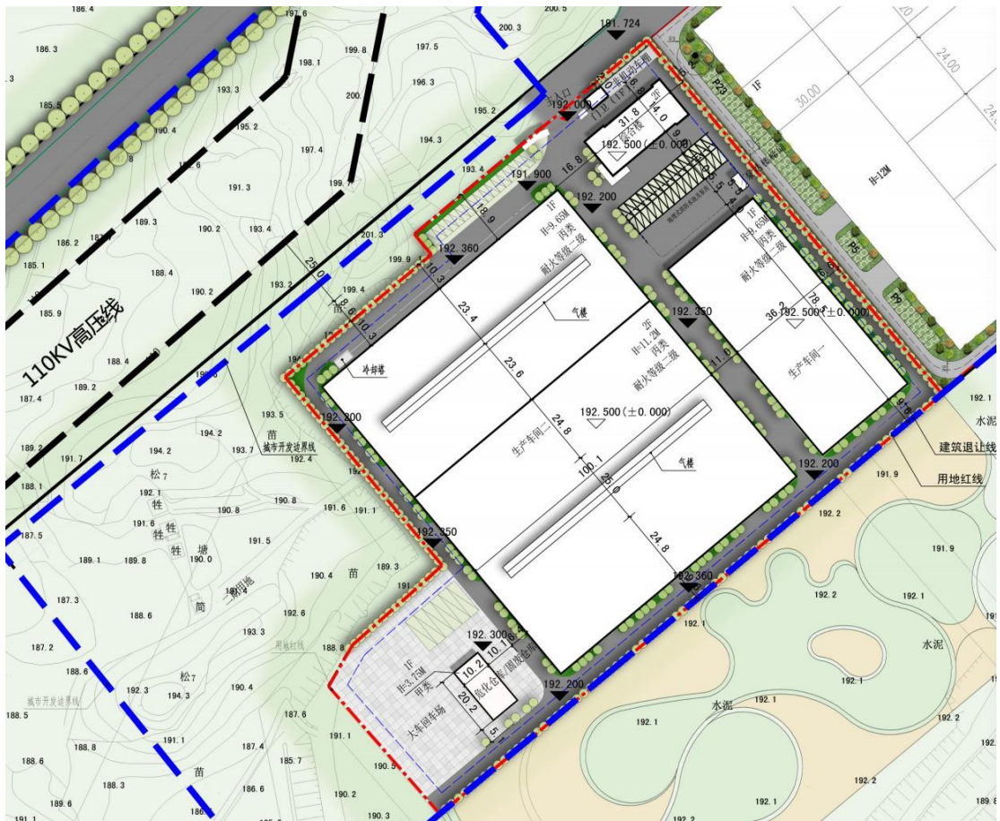
图 1.2-1 项目总平面布置图