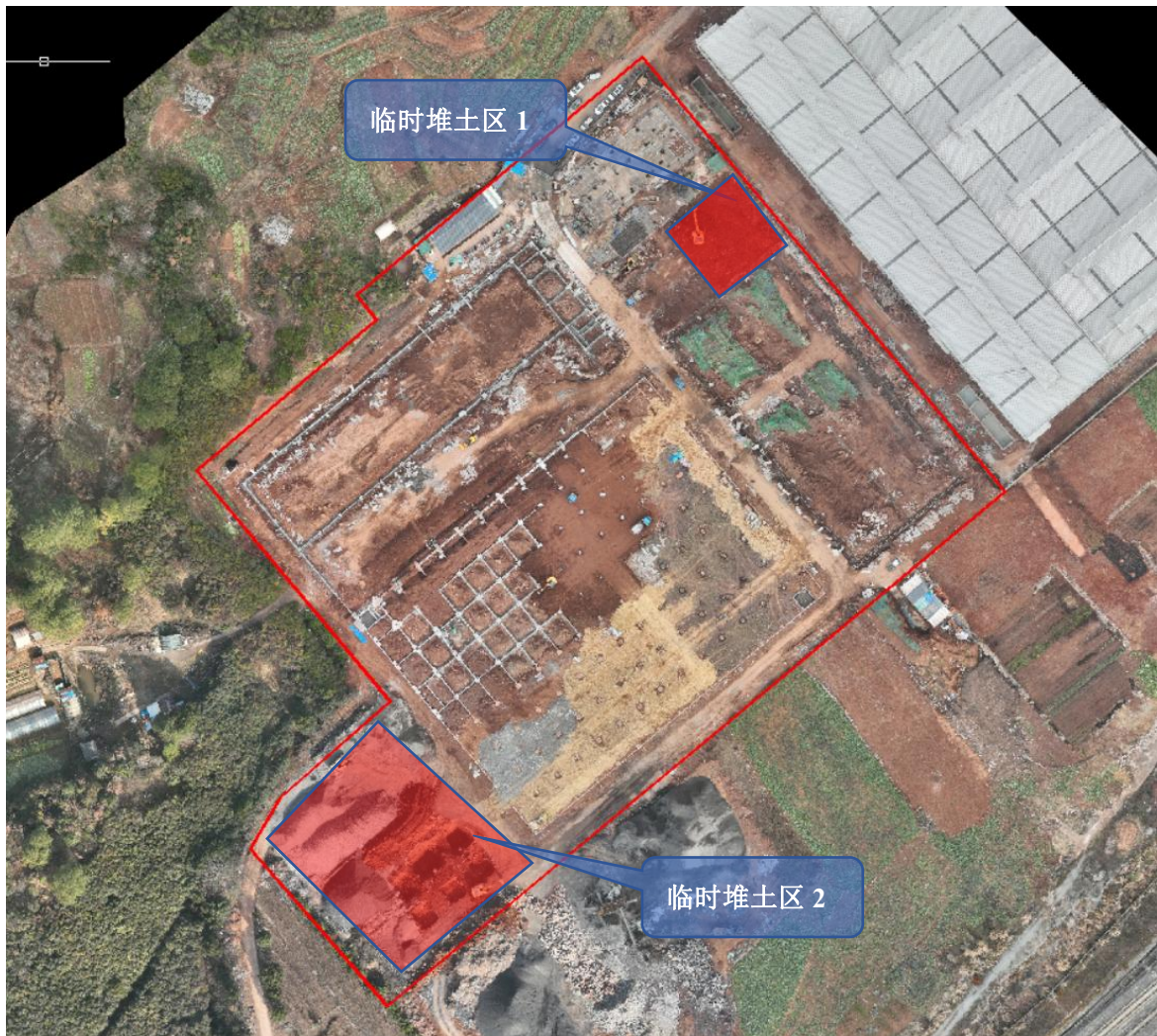
图 1.3-2 临时堆土区位置图

根据现场调查，临时堆土区2现场有临时堆料，堆料为其他项目堆料，业主已与堆料单位沟通，近期内堆料运走。