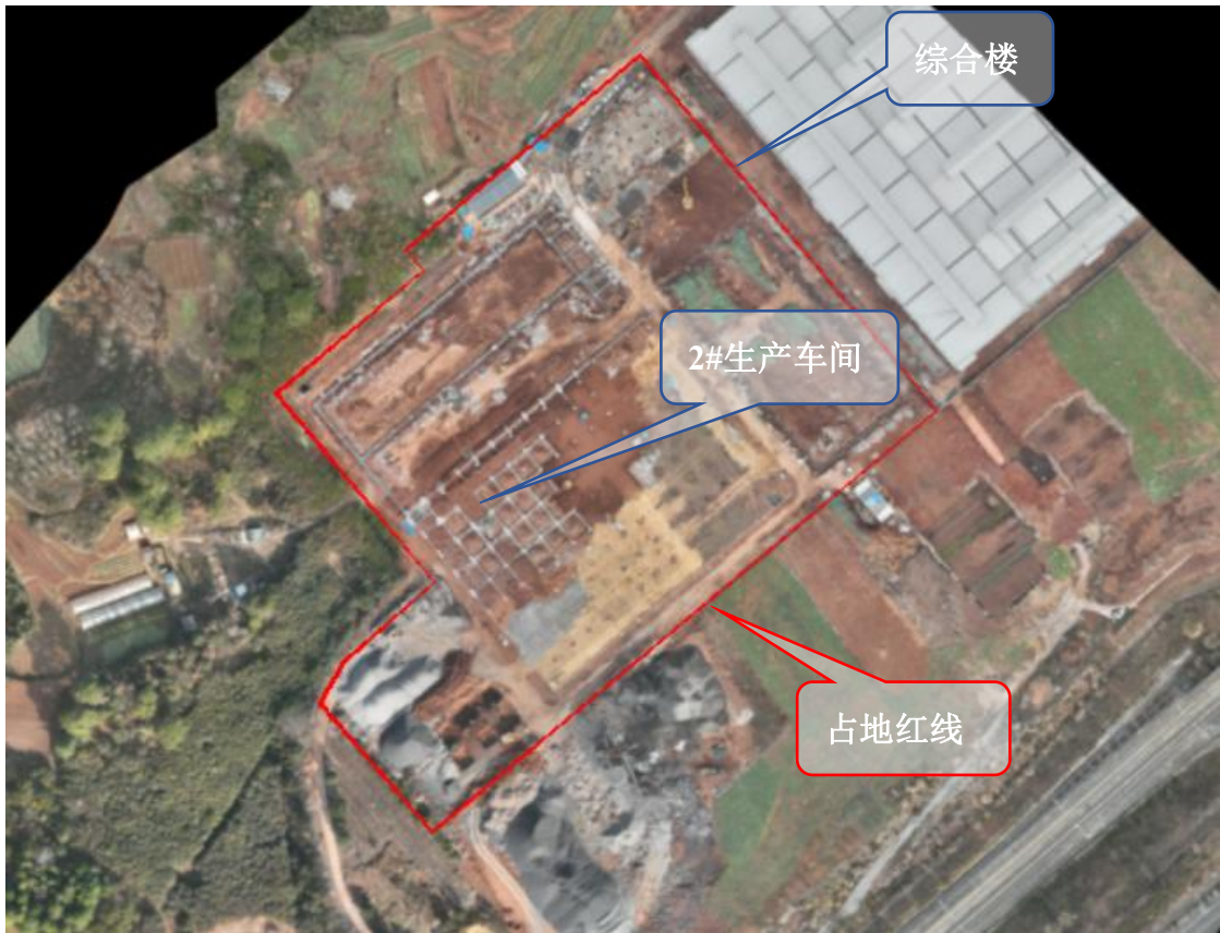
图 1.1-1 项目现场航拍图