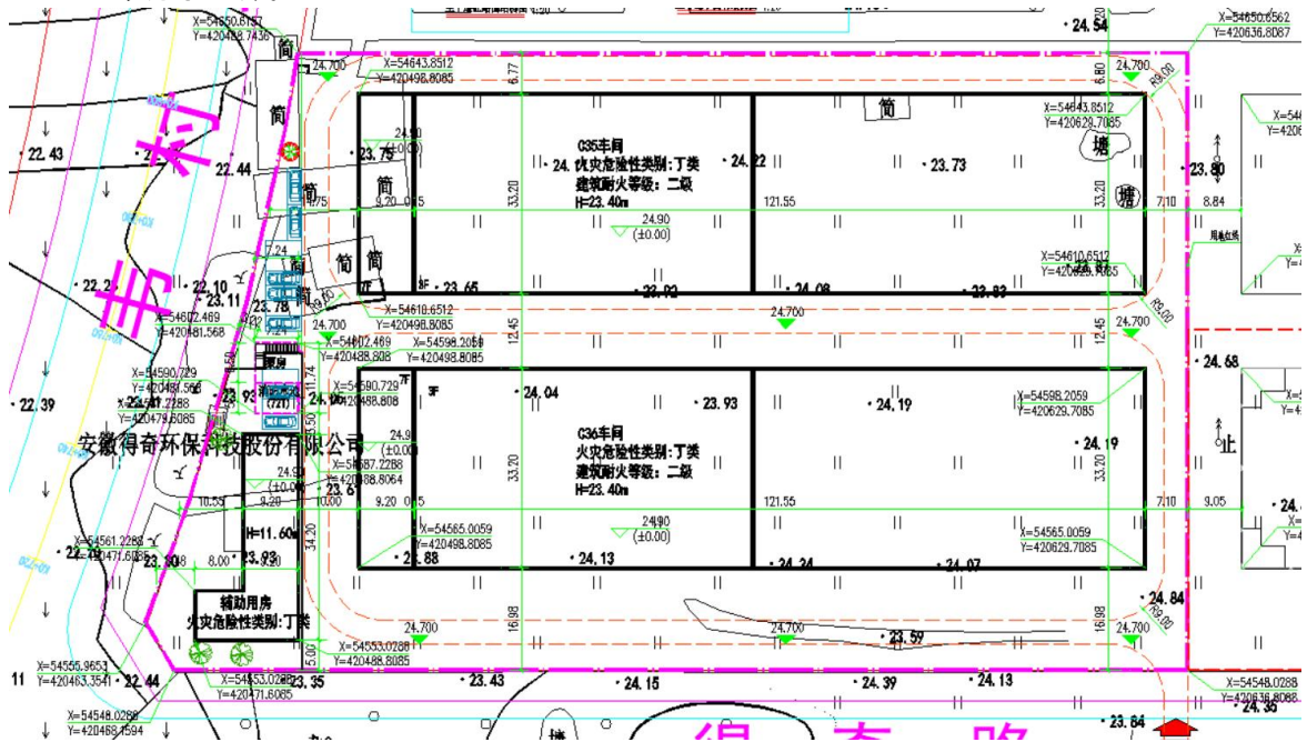
图 1.2-1 项目总平面布置图

项目由建筑物和配套附属设施组成，其中建筑物包括 C35 车间、C36 车间、辅助用房、泵房及消防水池，配套附属设施包括厂区道路、绿化、雨污水管网、通讯设备等设施。