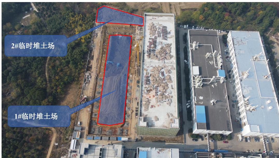
图 1.3-2 临时堆土场位置图