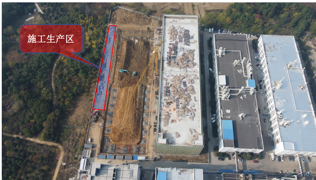
图 1.3-1 施工生产区位置图

根据主设，本项目位于郎溪县经济开发区得奇产业园内，施工生活区可以利用得奇产业园现有生活区，无需单独布设施工生活区。施工生产区布设在厂区南侧靠近围墙处，红线范围内，占地面积为 735m 2 ，建筑物主体建设完工后，建设为厂区内部道路和厂区绿化。