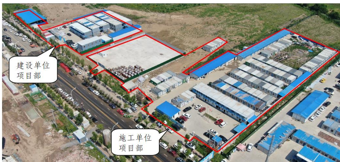
施工生产生活场地布图（2022 年 7 月）

本工程布设 1 处施工生产生活区，主要为建设单位和施工单位的项目部、生活区及材料堆场。相邻布设在红线外北侧区域，建设单位项目部占地 0.38hm 2 ，施工单位项目部占地为 1.04hm 2 。现已移交给二期工程使用，移交说明见附件。