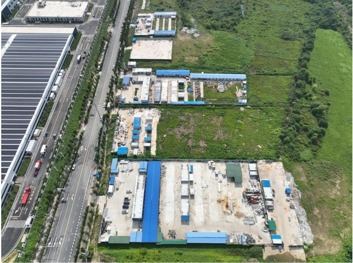
施工生产生活场地布图（2023年7月）