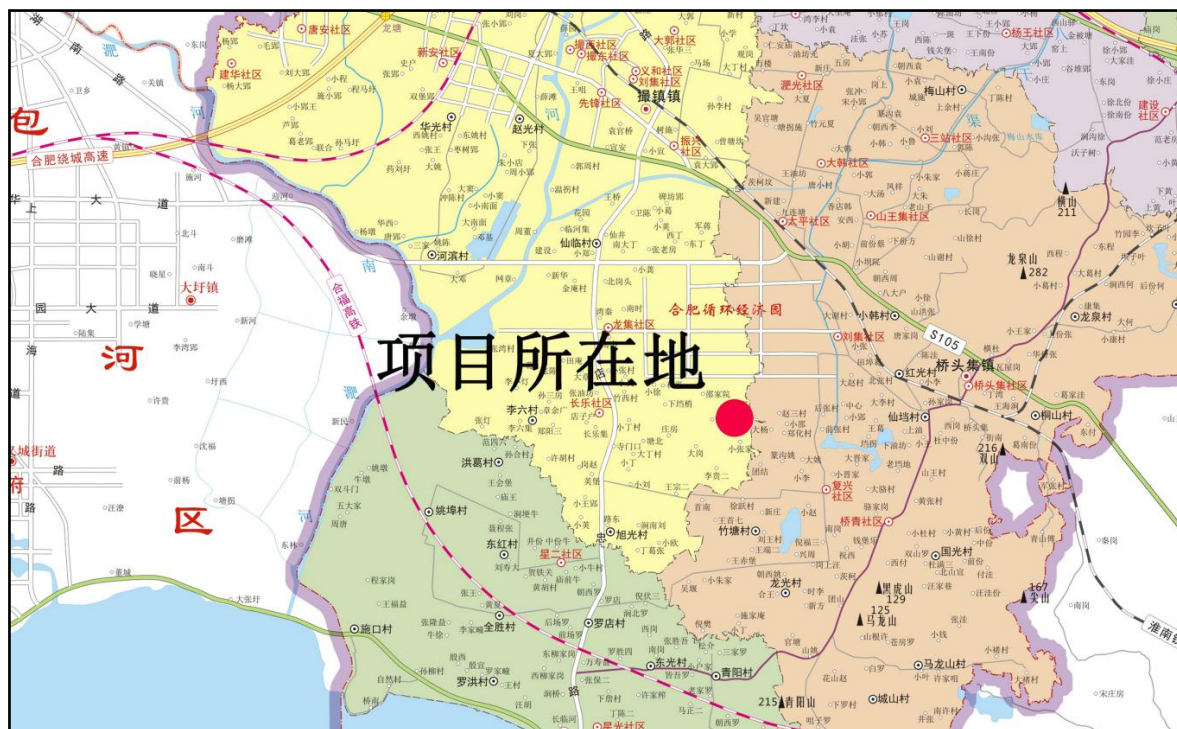
图 1.1 项目地理位置图