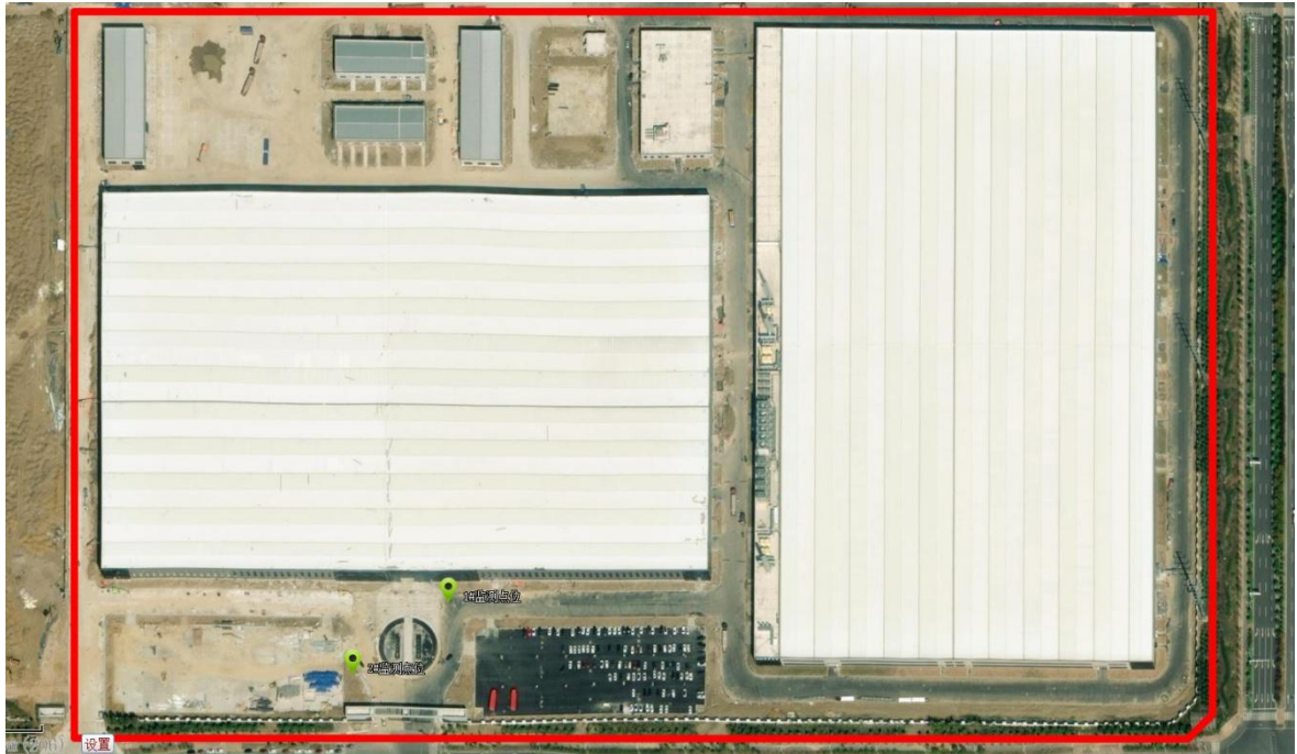
图 1.4 监测点位布设图