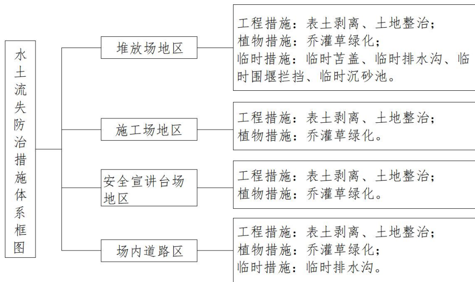
图 5.1 水土流失防治措施体系框图