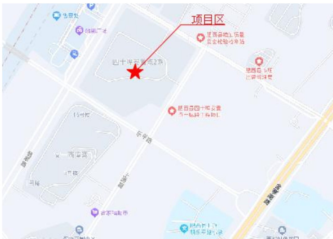
图 1.1 项目区地理位置图

上派镇新四十埠安置点二期项目位于安徽省合肥市肥西县上派镇乐平路以北，翡翠路以东，项目交通便利。具体位置见图 1.1。