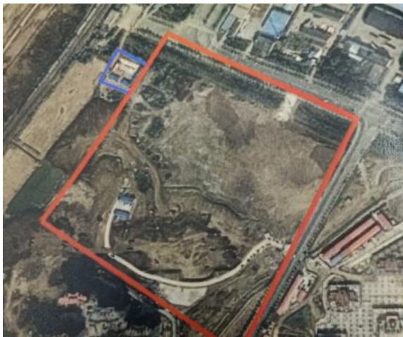
施工生产生活区遥感影像（2017 年 11 月）

根据主体施工总体布置，项目区外西北角布设一处施工生产生活区，施工生产生活区占地面积 0.15hm 2 。施工场地主要作为安装场、机械存放地、材料仓库、拌和场、临时堆料场、预制场等，施工生活区租用当地民房。施工结束后，建设单位恢复施工生产生活区原有占地类型，并且撒播草籽。后该区域用于城市绿地的建设。