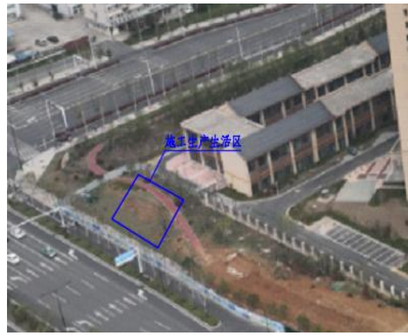
施工生产生活区现状图（2023 年 3 月）