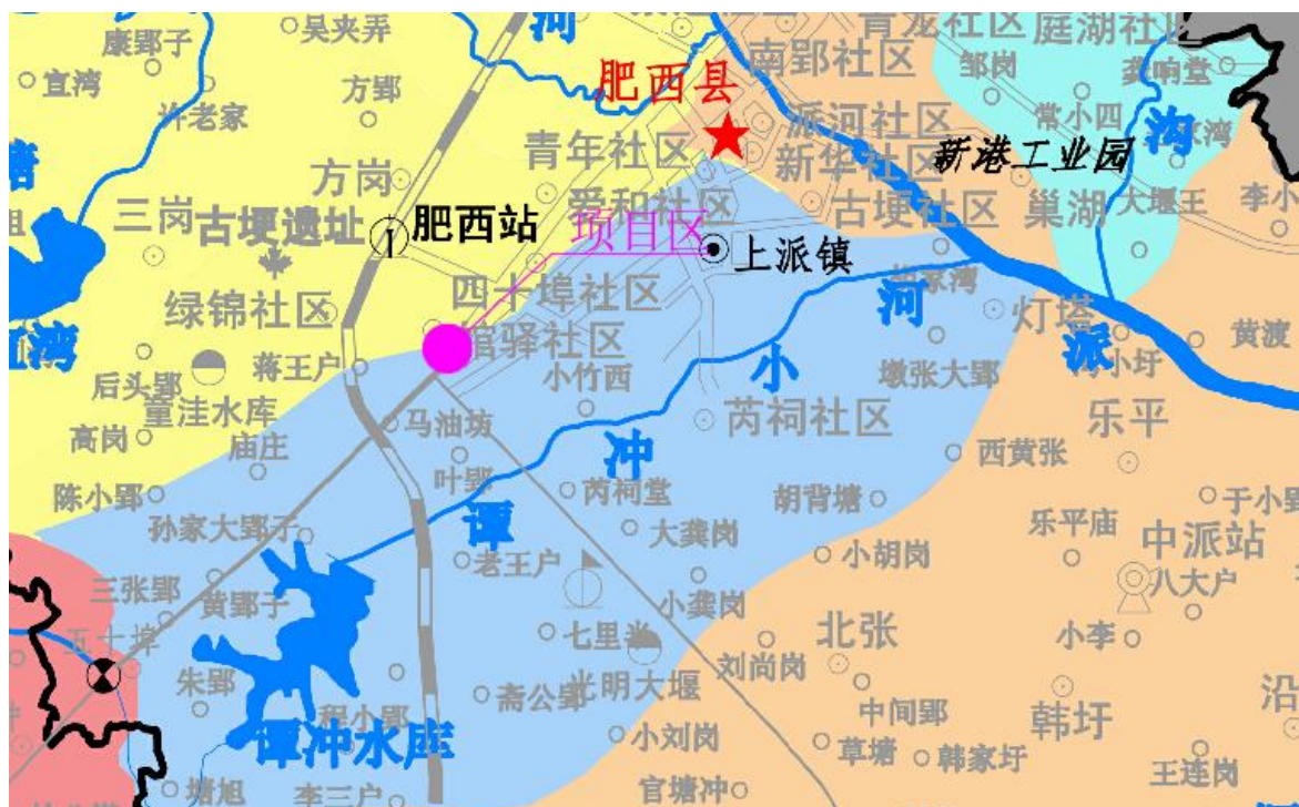
图1.3 项目区河流水系图